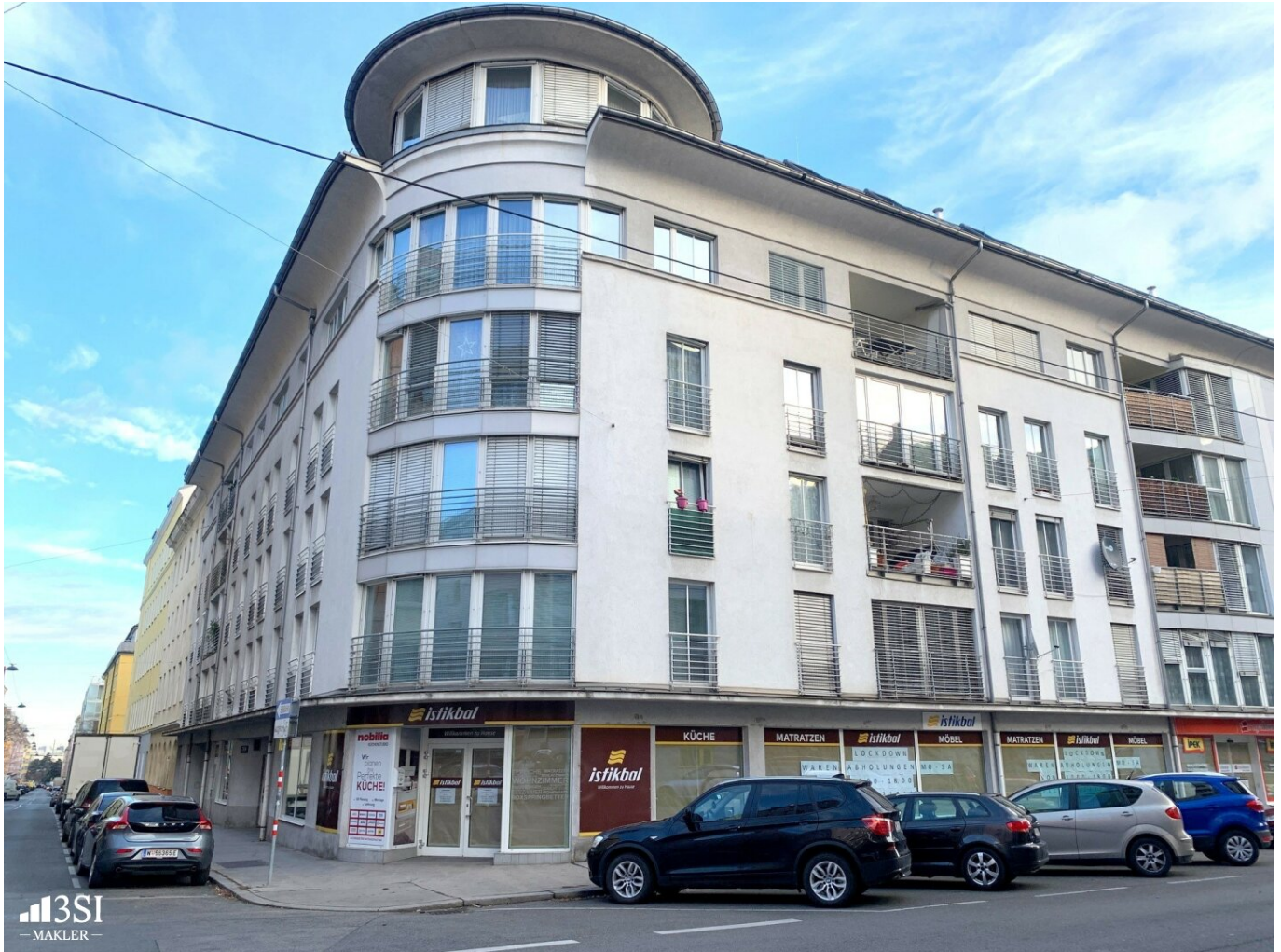
Renditeobjekt Rotenhofgasse Geschäftslokal

Objektnummer: 16466 Eine Immobilie von IMMOfair