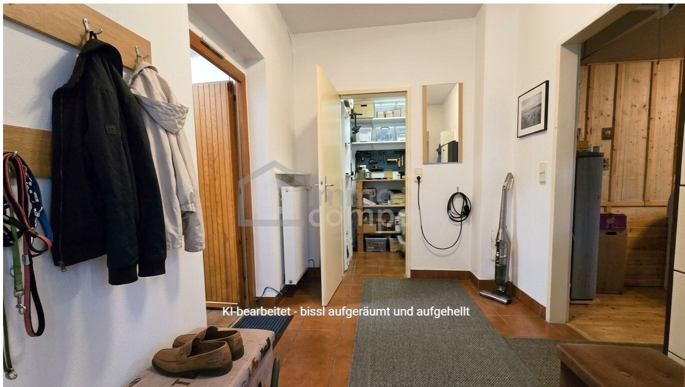
KI-bearbeitet - bissl aufgeräumt und aufgehell