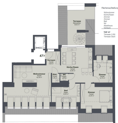
2. DACHGESCHOSS Trubelgasse