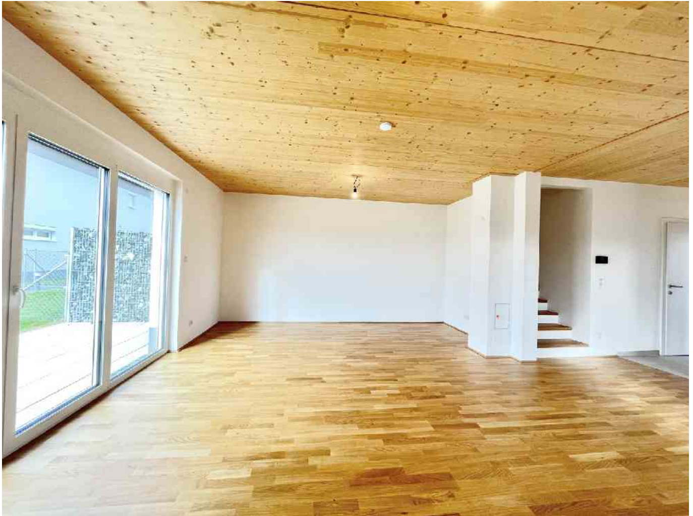
Wohnraum mit Terrass

Objektnummer: 141/86053 Eine Immobilie von Rustler