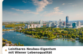
Leistbares Neubau-Eigentum mit Wiener Lebensqualität