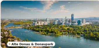
Alte Donau & Donaupark

Alte Donau, Donaupark und aktive Naherholung