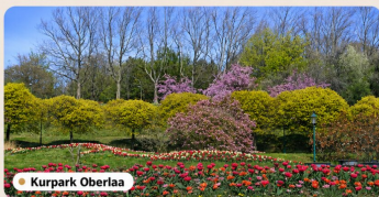
• Kurpark Oberlaa