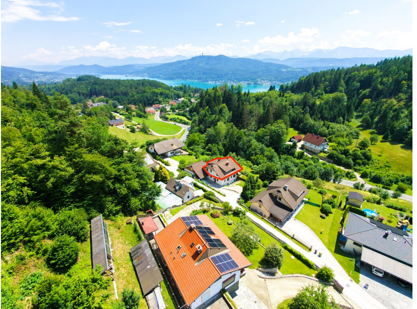
Luftbild Weitblick mit eingezeichnetem Objekt