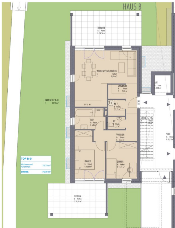
0. Erdgeschoss Haus B 75 1:100