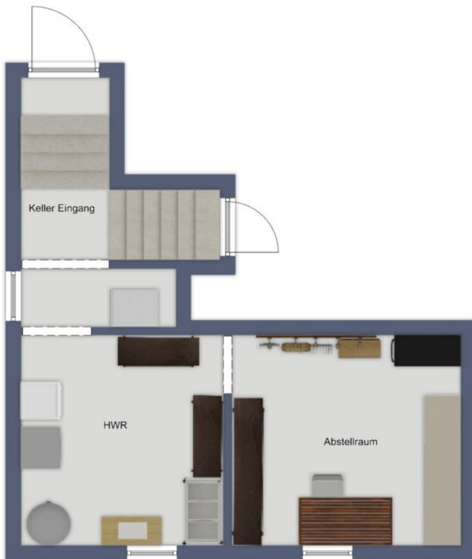
Exposèplan - nicht maßstäblich!