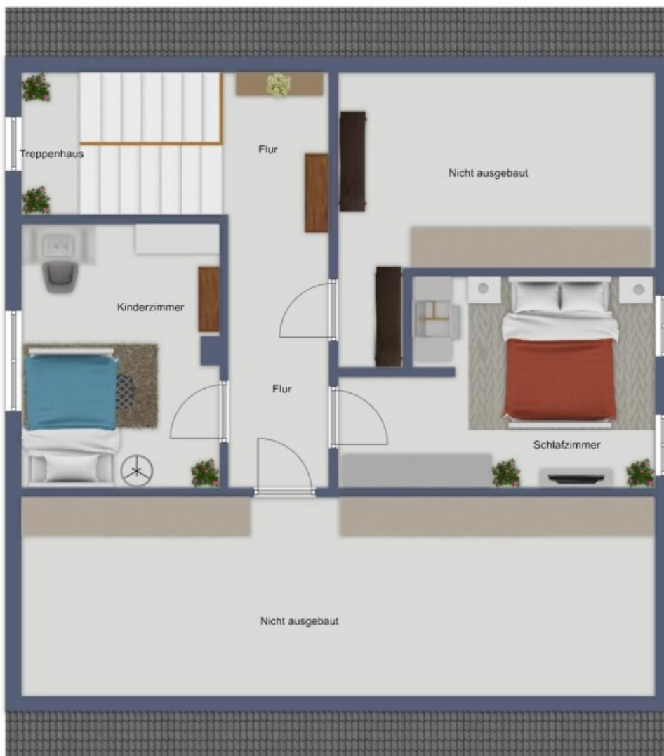
Exposèplan - nicht maßstäblich!