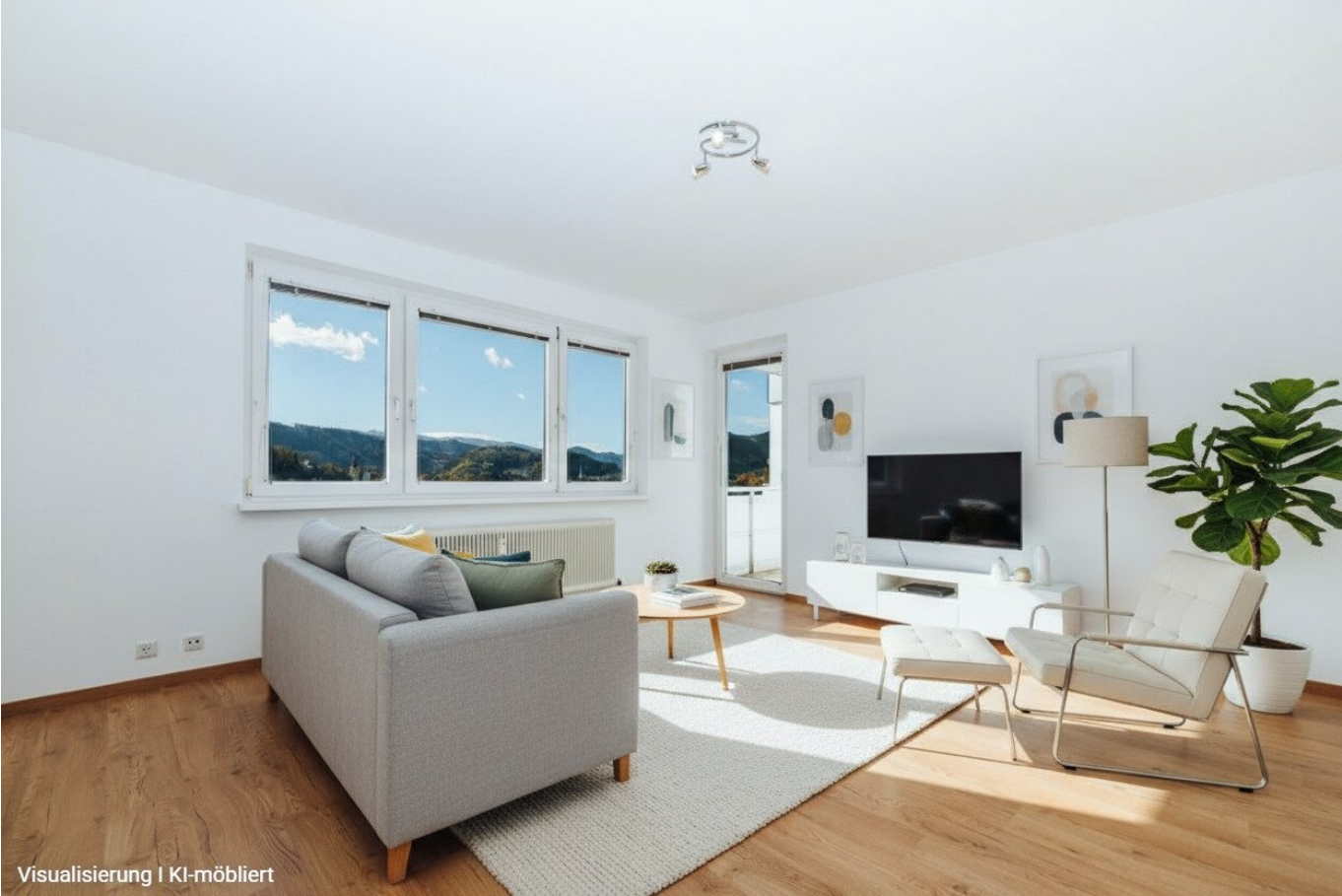
Visualisierung | KI-möbliert