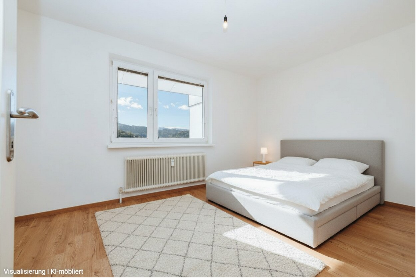
Visualisierung | KI-möbliert