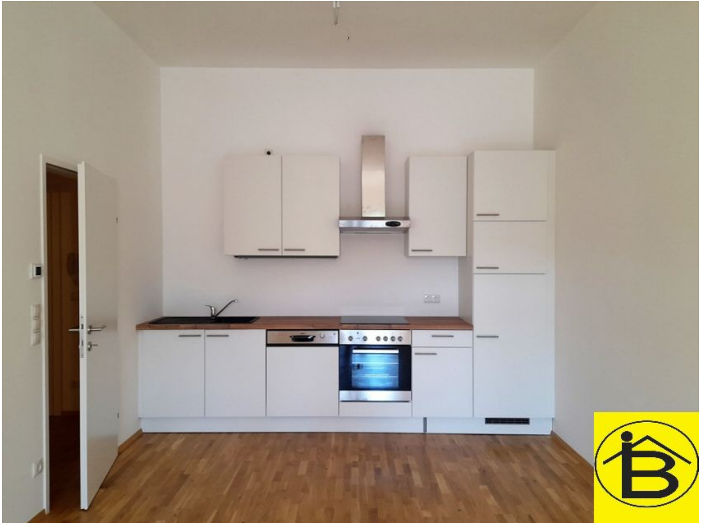
Top 14 Küchenzeile