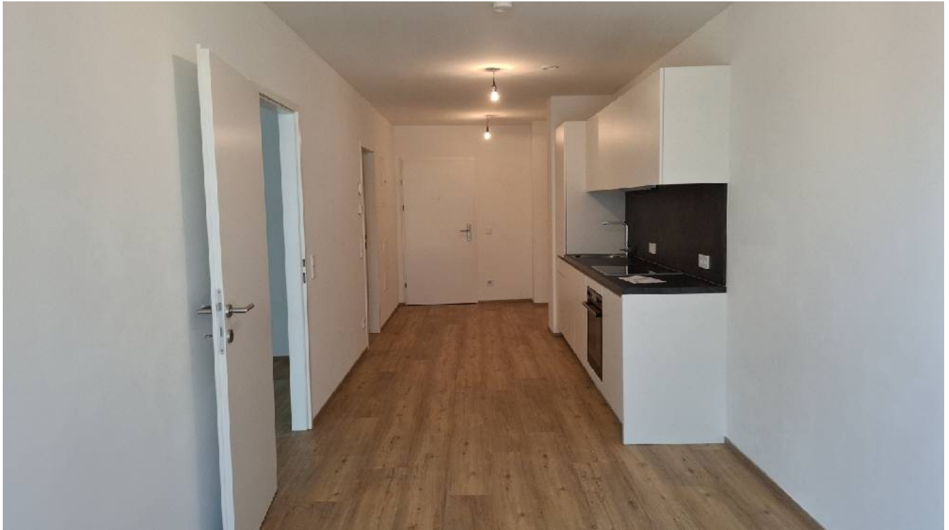
Küche - Eingangsbere

Objektnummer: 141/85881 Eine Immobilie von Rustler