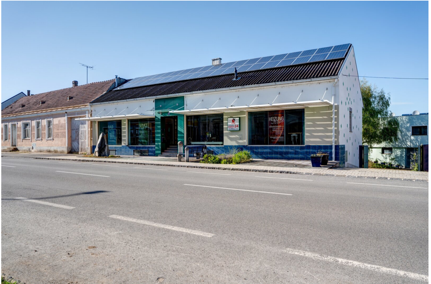
Front - Ansicht