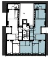
Czerninplatz 1. DACHGESCHOSS