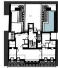
Czerninplatz 2. DACHGESCHOSS