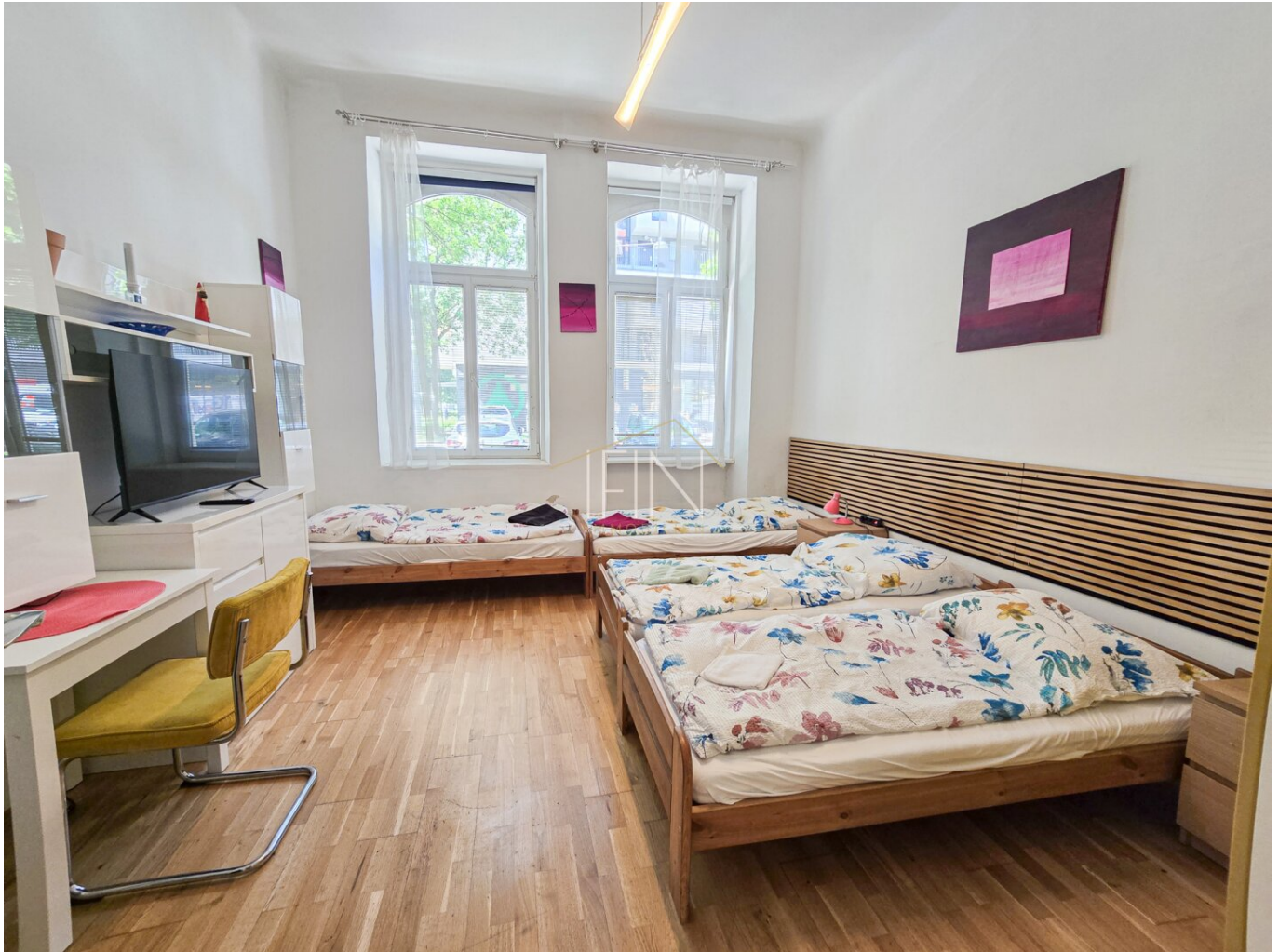
Wohnung 2) Wohn-/Schlafzimmer