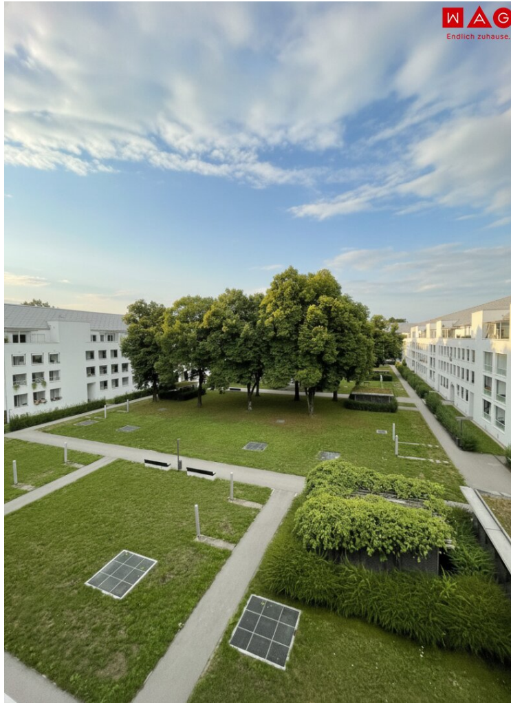
Ausblick / Außenansicht

Kleine 3-Raum-Dachgeschosswohnung mit großer Terrasse(15 m 2 ) in Linz/Bindermichl! ACHTUNG Wohnung befindet sich noch in Sanierung! Bezug mit 01. Juli 2026!