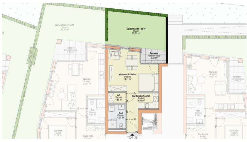
Top 19 - 1:100