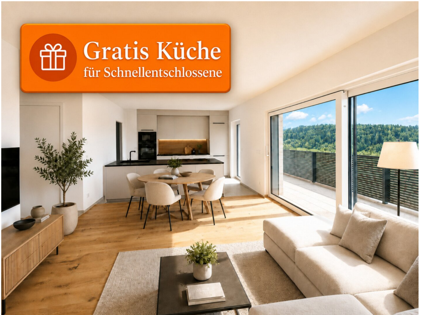
Visualisierung Küche Angebot