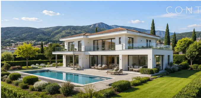
OFF MARKETS FÜR VILLENBAUGRÜNDE