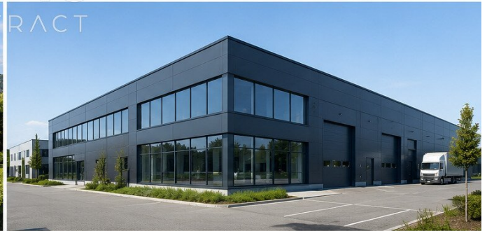
OFF MARKETS FÜR GEWERBLICHE OBJEKTE