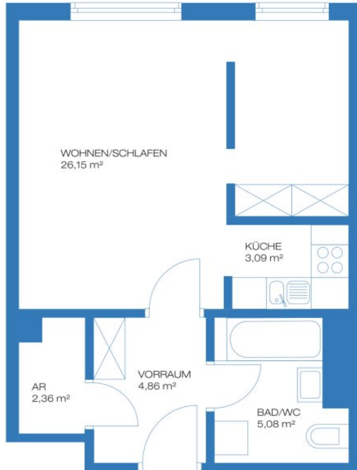
TYP A1B GESAMTLÄCHE ab 41,54 m 2