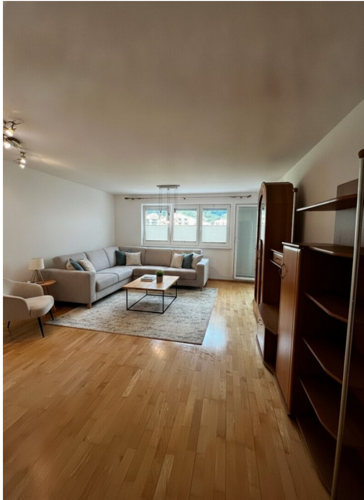
Wohnzimmer virtuell eingerichtet

Zentrum: 3 Zimmer + zusätzlicher Wohnraum durch Loggia | TG-Stellplatz | Nähe Tyrolit und Krankenhaus