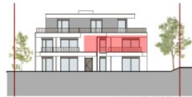
ANSICHT WEST 1/500