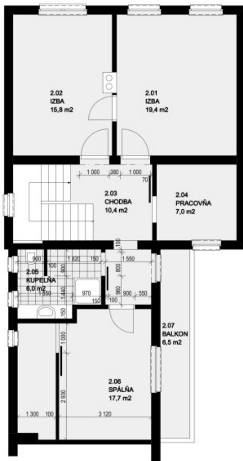
POSCHODIE - NOVÝ STAV