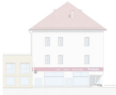
ANSICHT SÜDOST_M 1:100