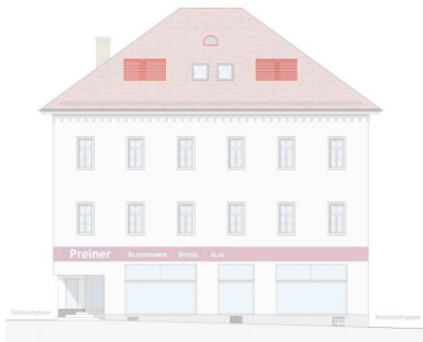
ANSICHT SÜDWEST_M 1:100