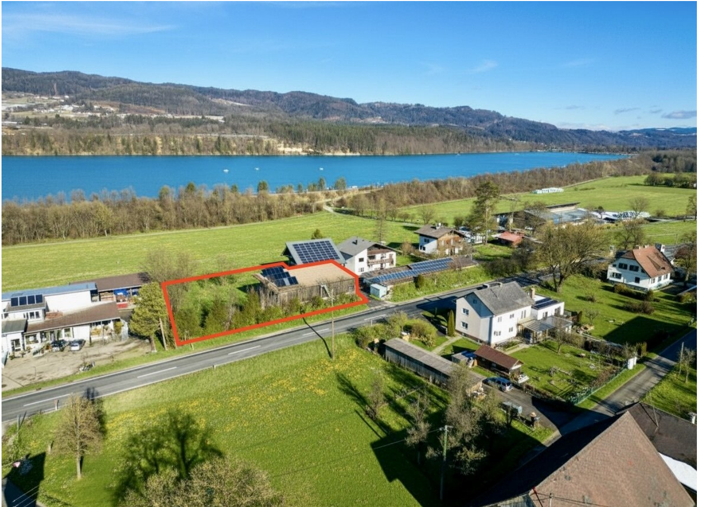
Luftbild mit eingezeichnetem Grundstück