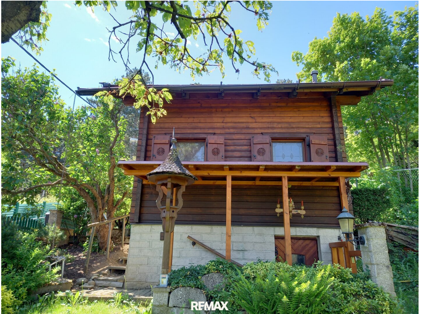
Haus Bild 1

Objektnummer: 1662/3141 Eine Immobilie von RE/MAX 4You