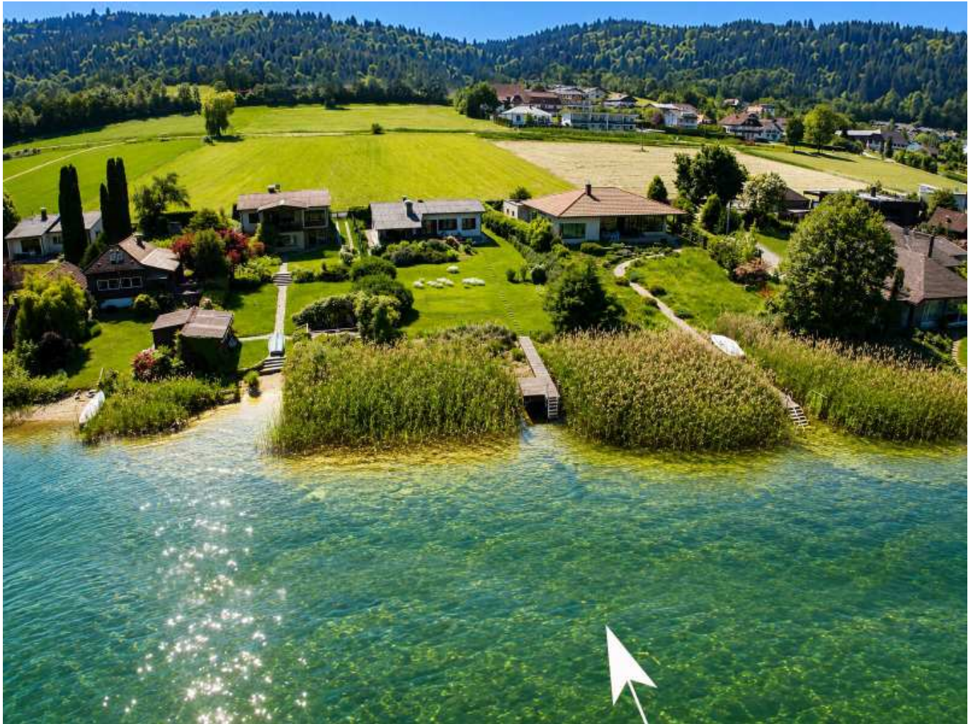
Seehaus Ossiacher Se

Objektnummer: 905/03657 Eine Immobilie von ATV Immobilien