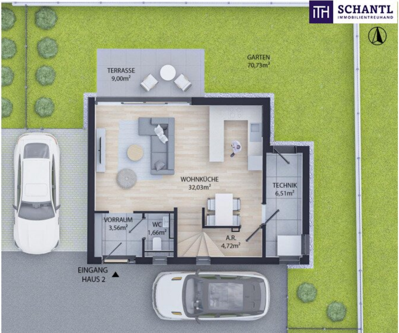
ERDGESCHOSS WNFL 48,48m 2