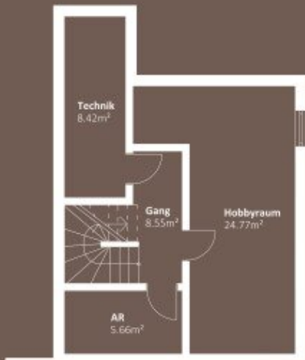
KELLERGESCHOSS WNF 47,40m 2