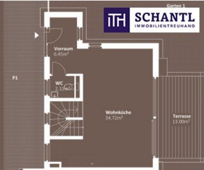
ERDGESCHOSS WNF 43,28m 2