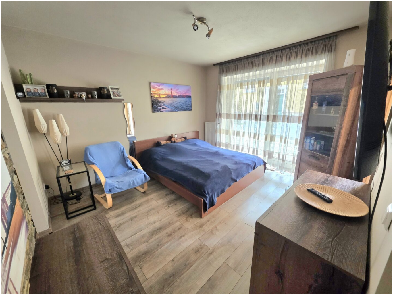
Wohn- und Schlafzimmer