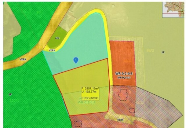
Auszug aus dem FLÄWI It. GIS Steiermark