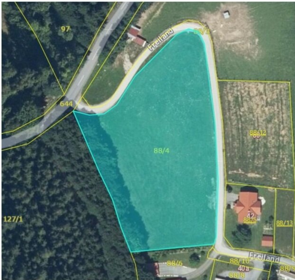
Luftbild – GIS Steiermark (Bewertungsgrundstück cyan hinterlegt)