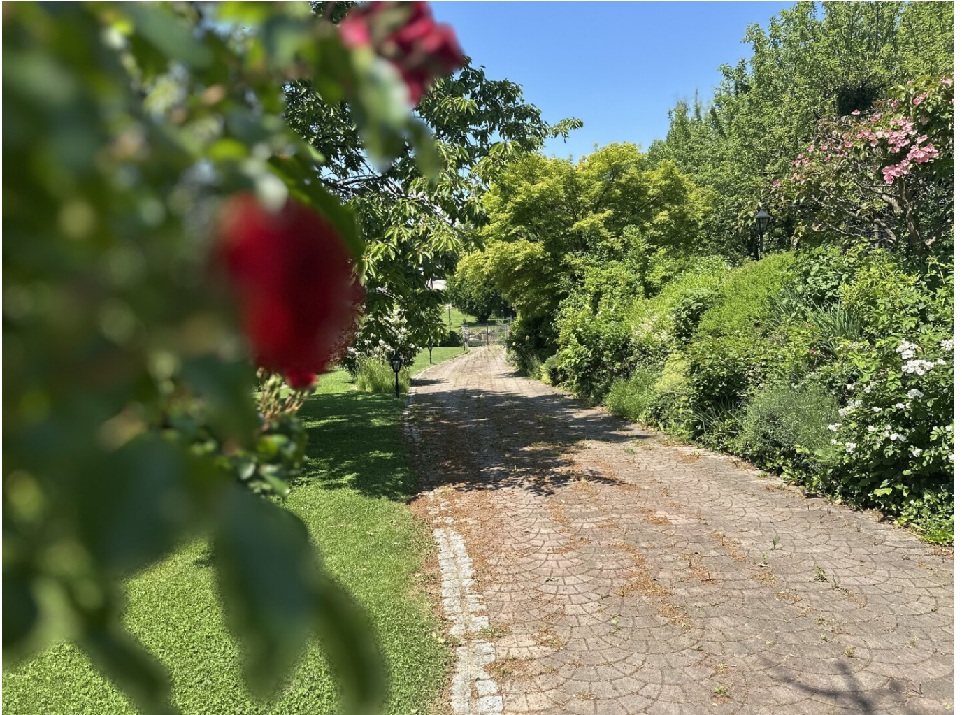
Einfahrt zum Haus