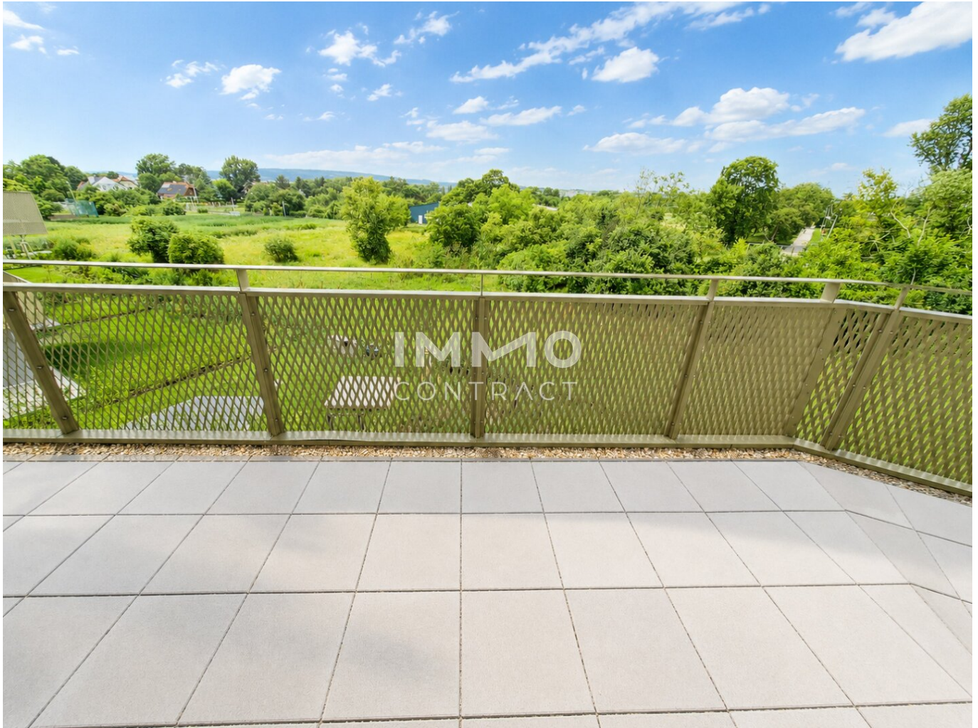
BALKON MIT GRÜNBLICK