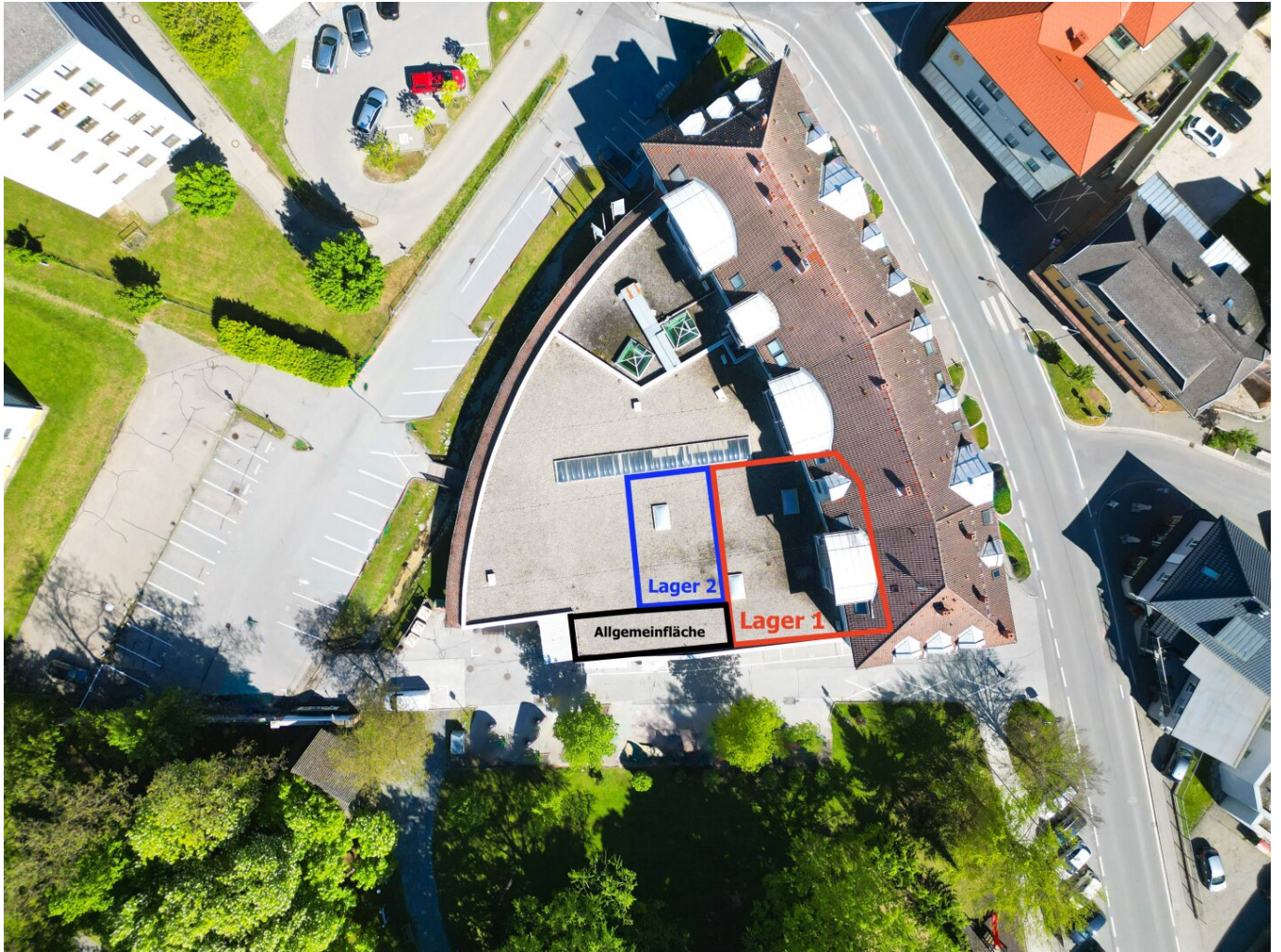
Luftbild mit eingezeichneten Flächen