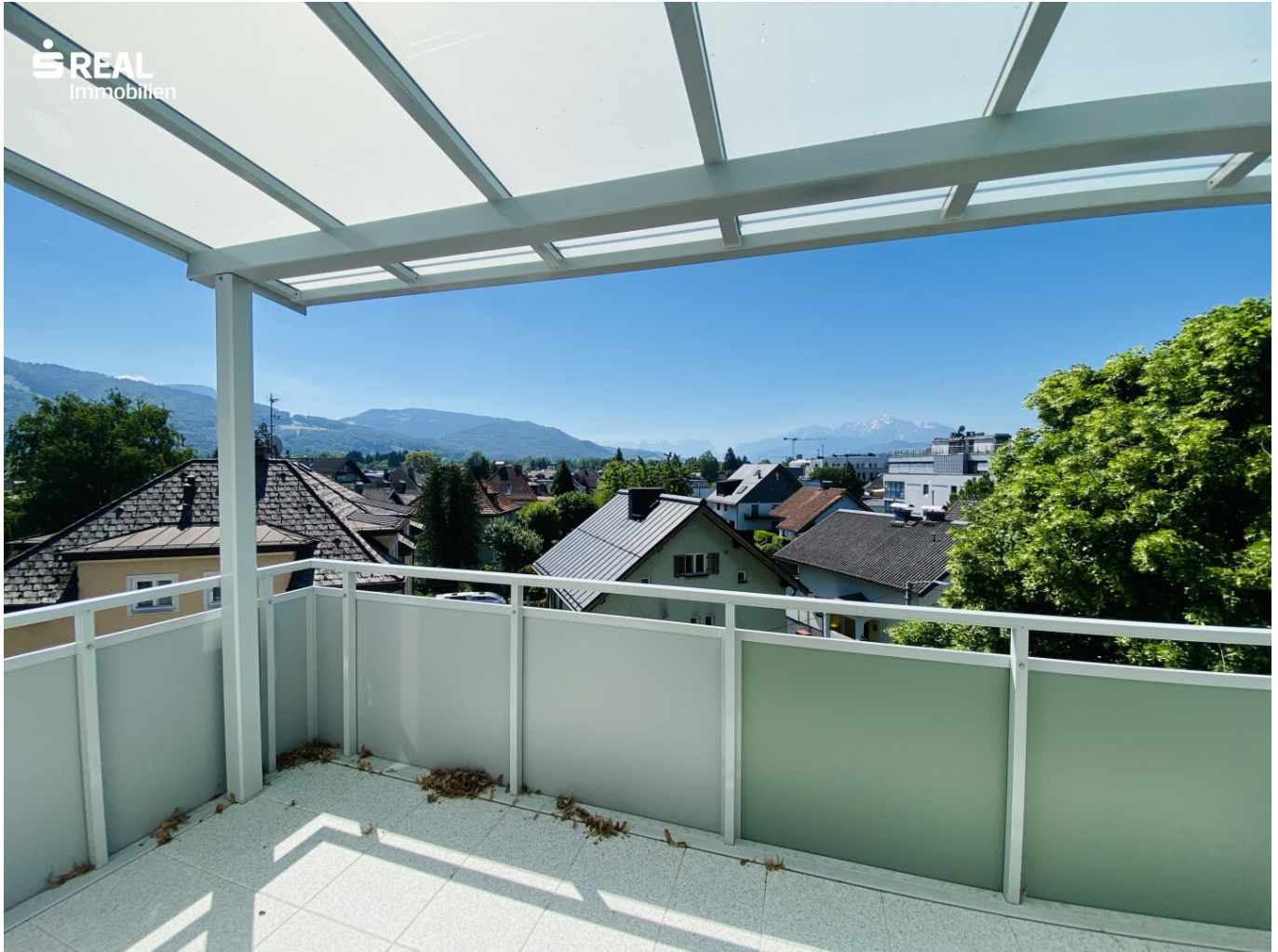
Balkon und Aussicht

Objektnummer: 960/74997 Eine Immobilie von s REAL