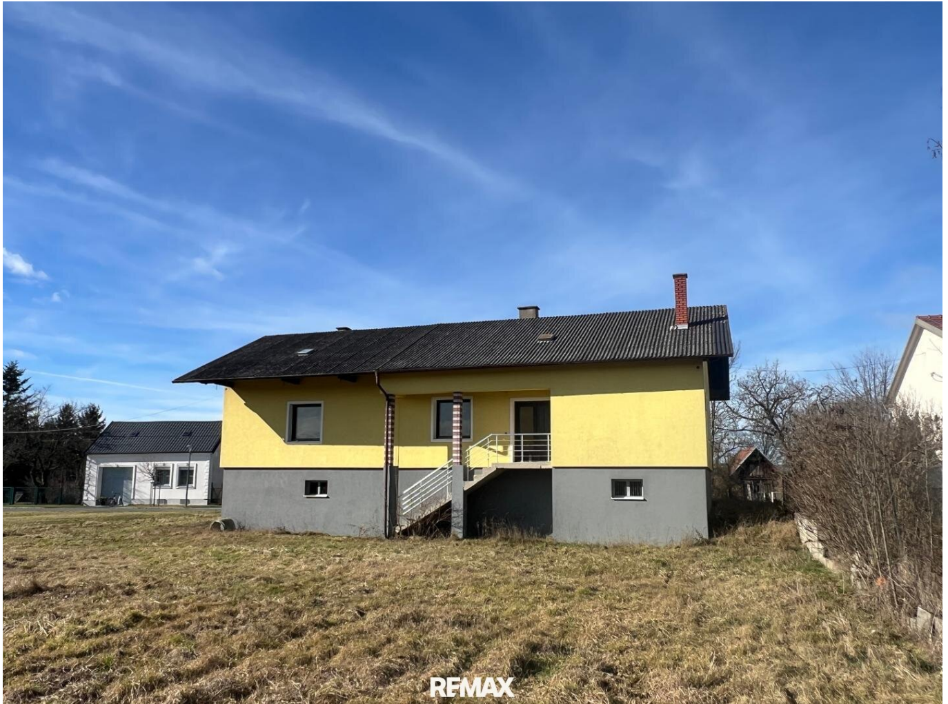
Ansicht vom Grundstück