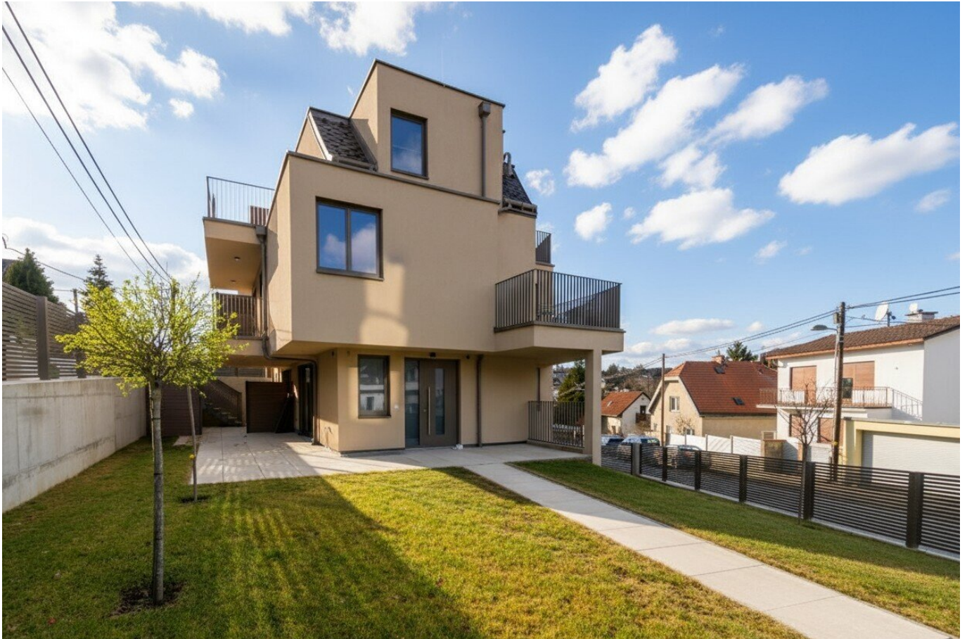
Hausansicht mit Garten