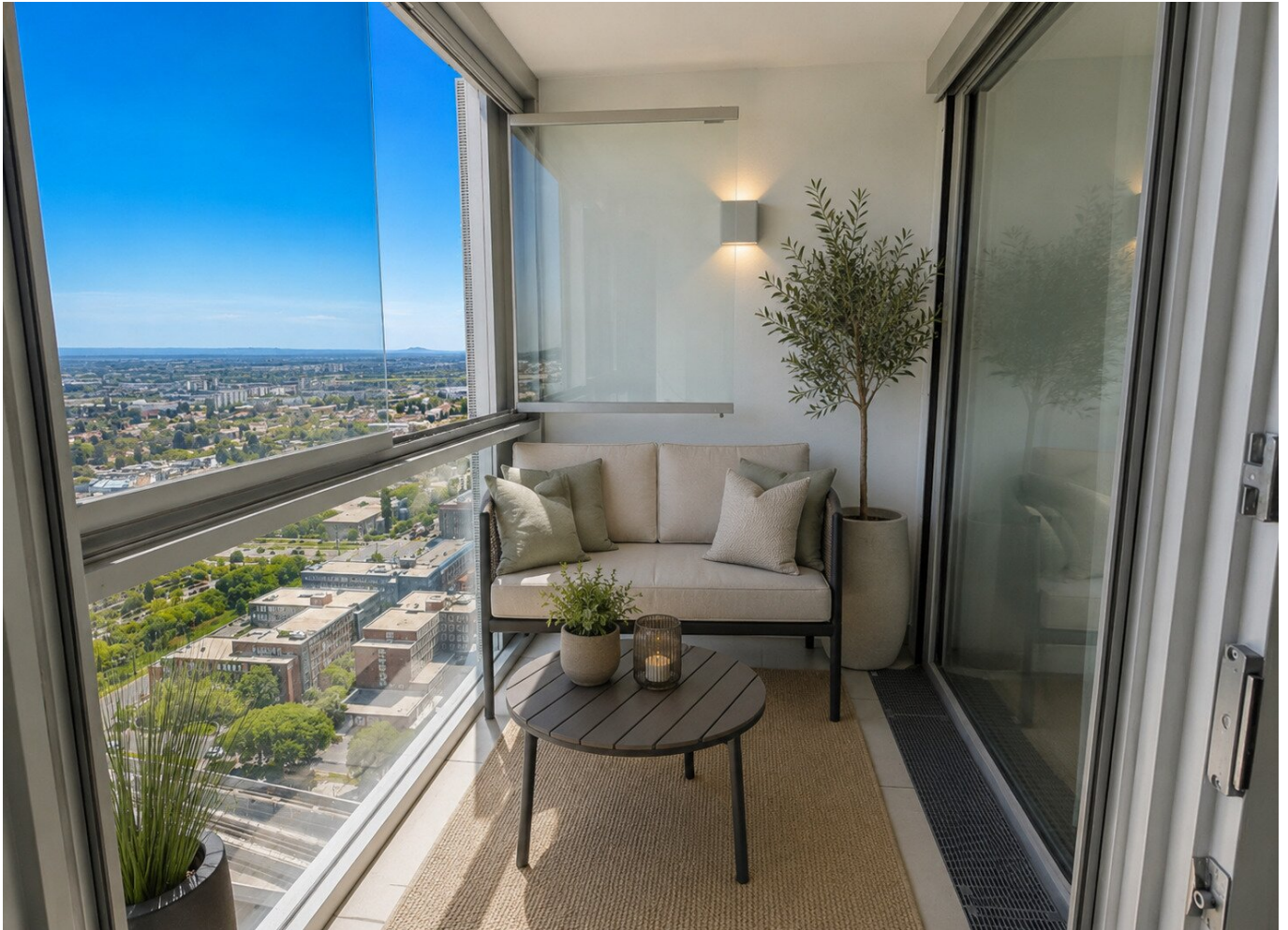
Loggia mit Aussicht