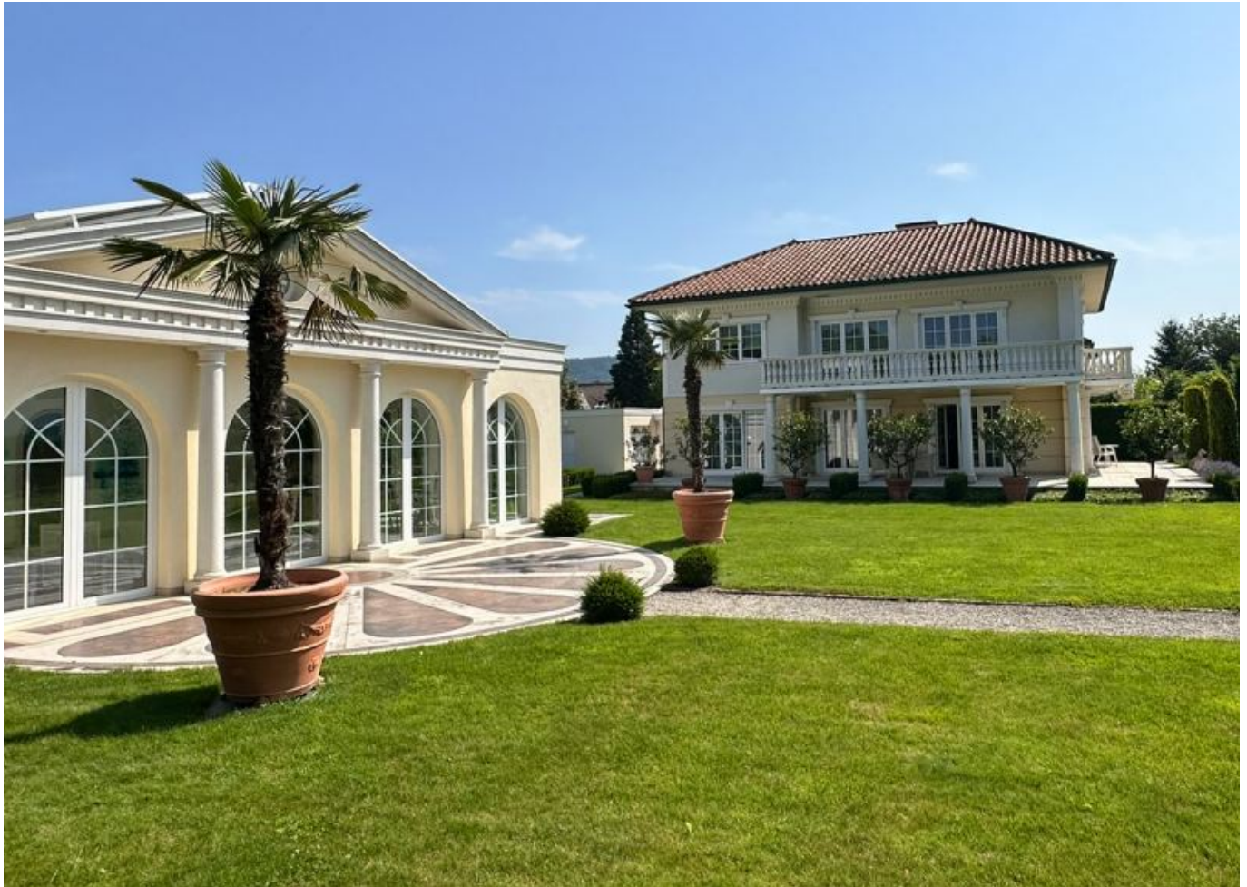
Villa Velden am Wört

Objektnummer: 905/03649 Eine Immobilie von ATV Immobilien