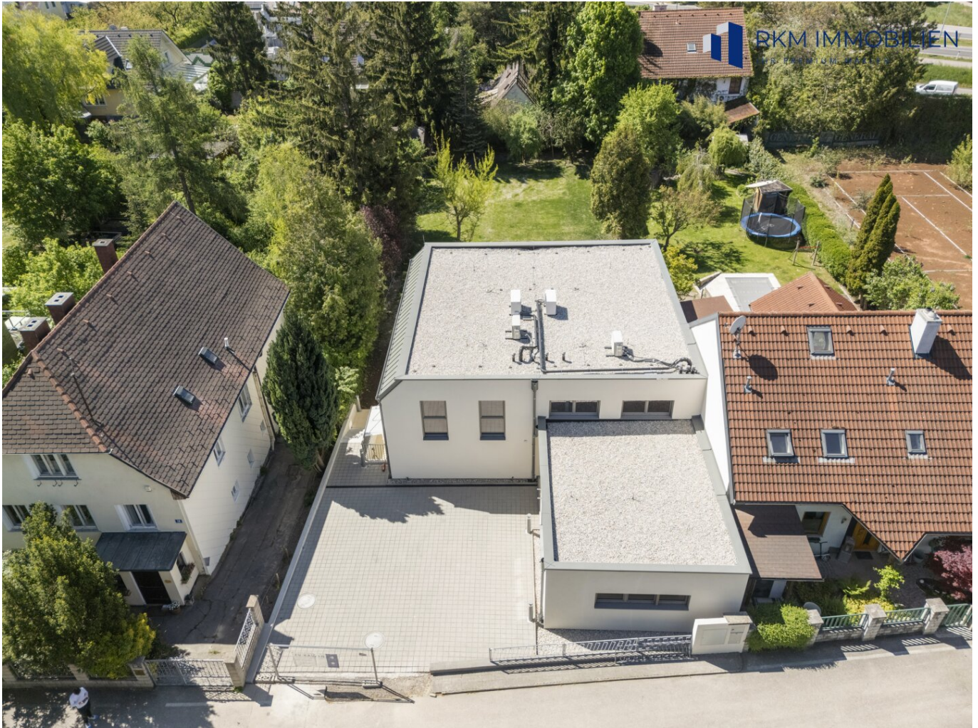
Haus von oben