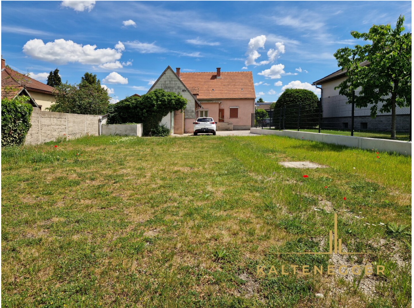
Garten mit Blick auf das Haus