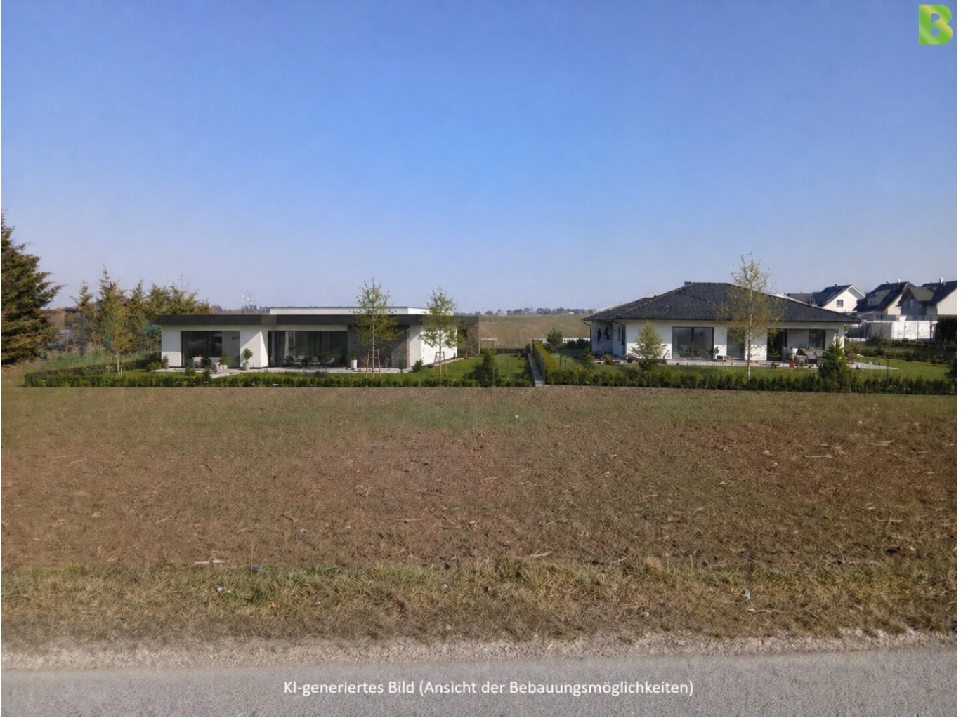
KI-generiertes Bild (Ansicht der Bebauungsmöglichkeiten)