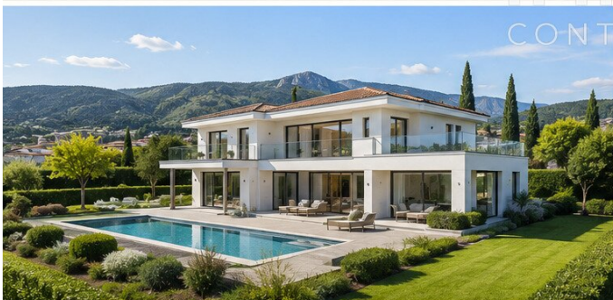
OFF MARKETS FÜR VILLENBAUGRÜNDE