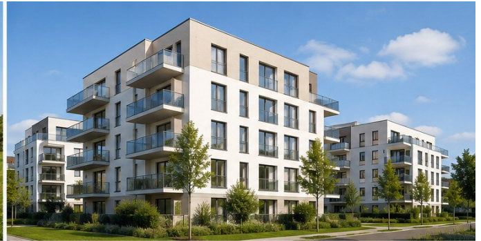
OFF MARKETS BAUGRÜNDE FÜR MEHRPARTEIENHÄUSER