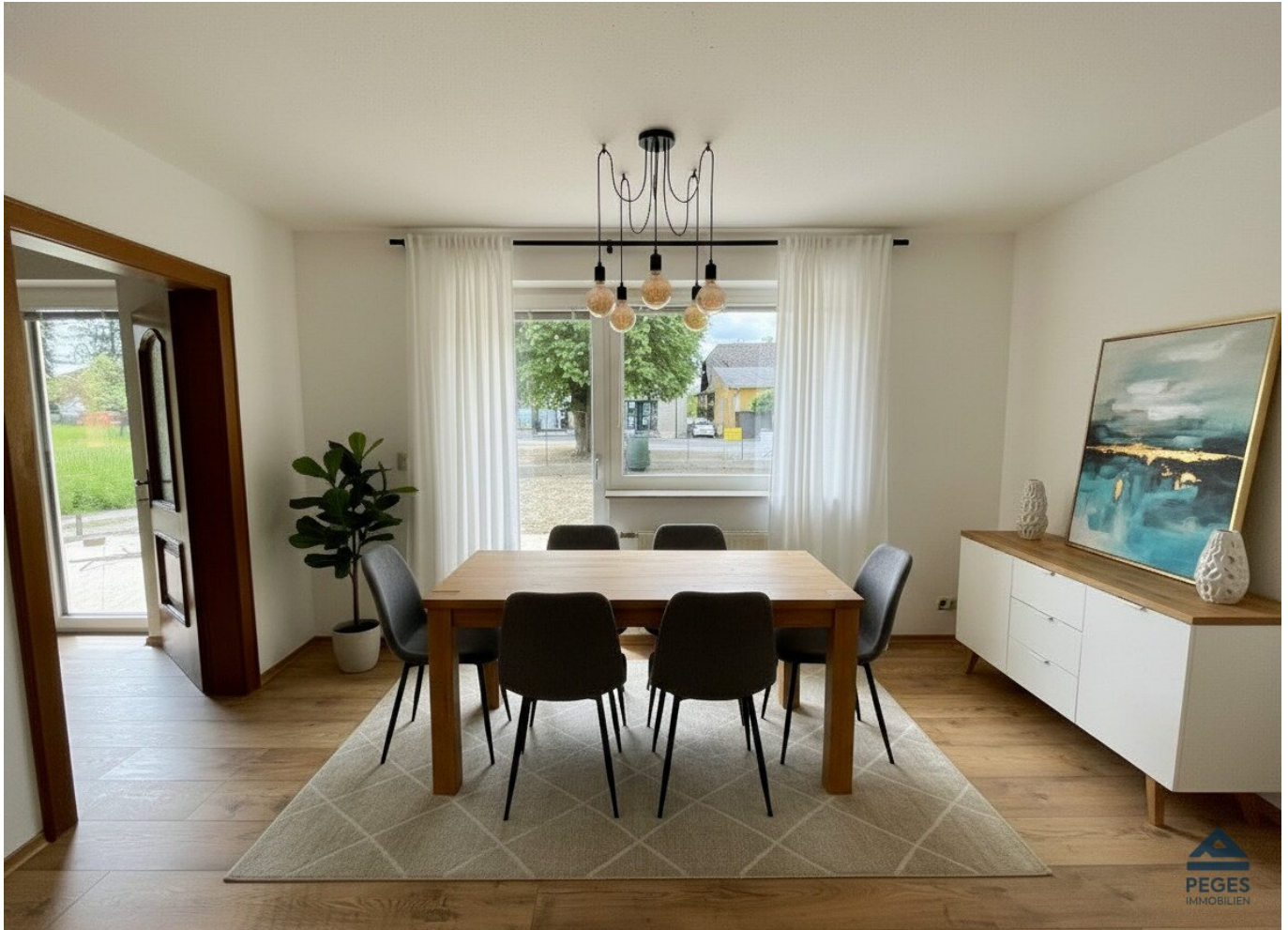
Essbereich mit Küche

Objektnummer: 7230/682 Eine Immobilie von Peges