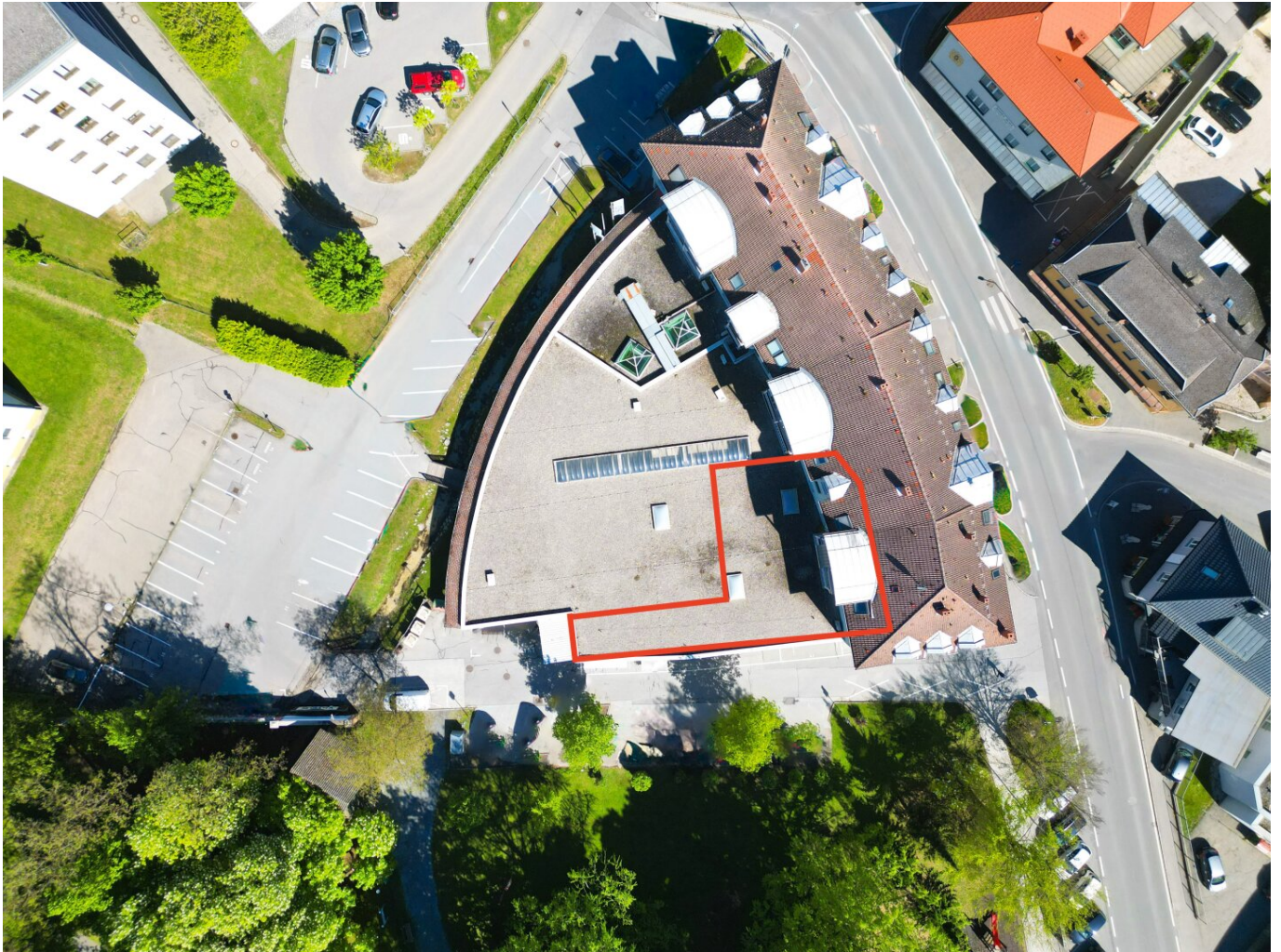
Luftbild mit eingezeichnetem Objekt