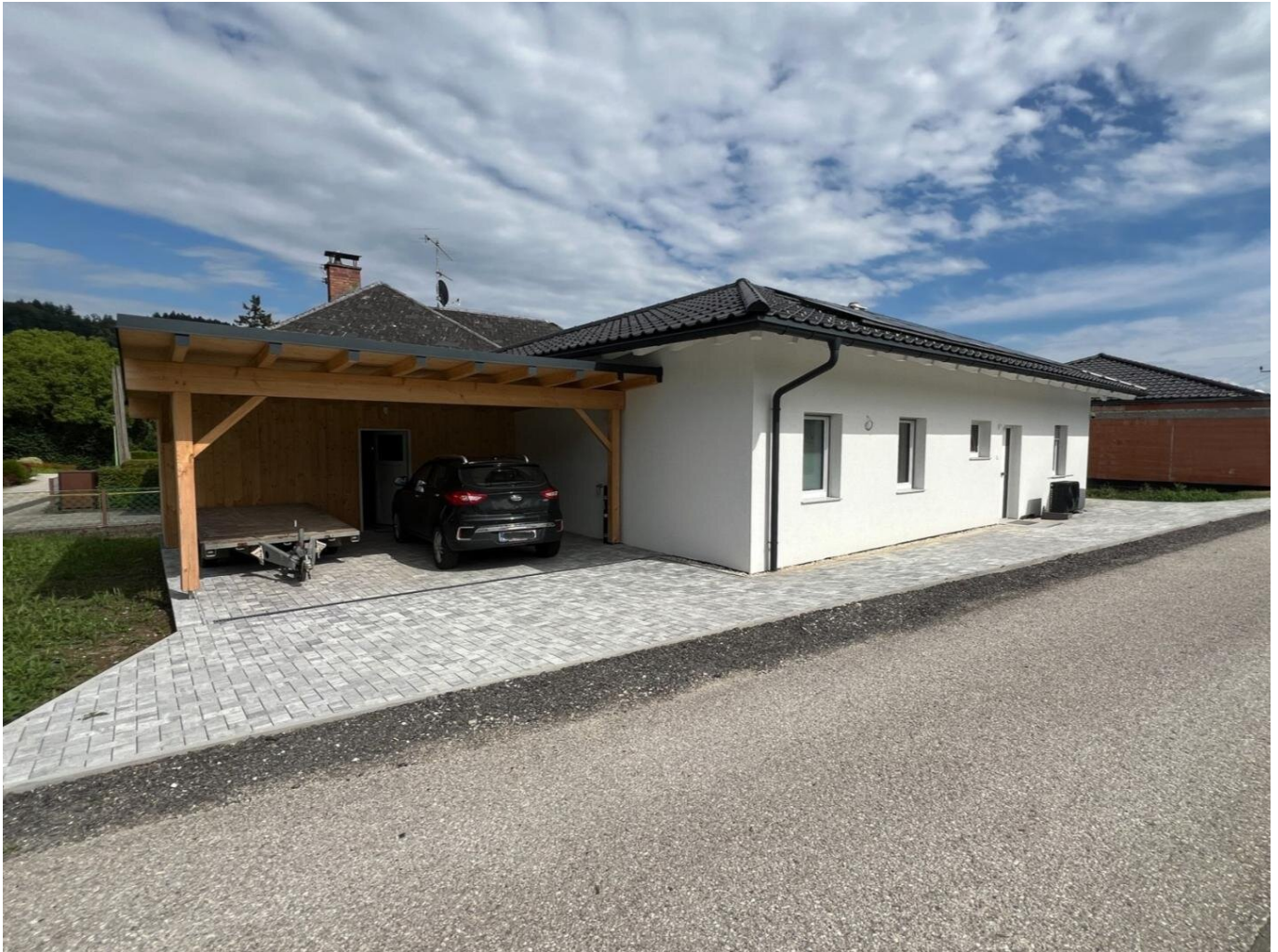
Carport und Abstellraum