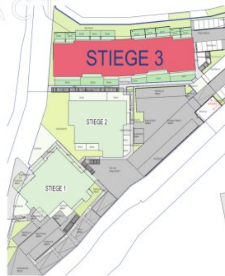
Lageplan Übersicht Stiegen