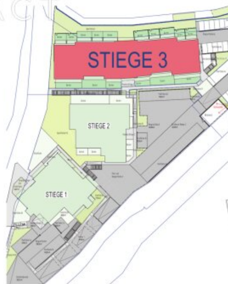
Lageplan Übersicht Stiegen