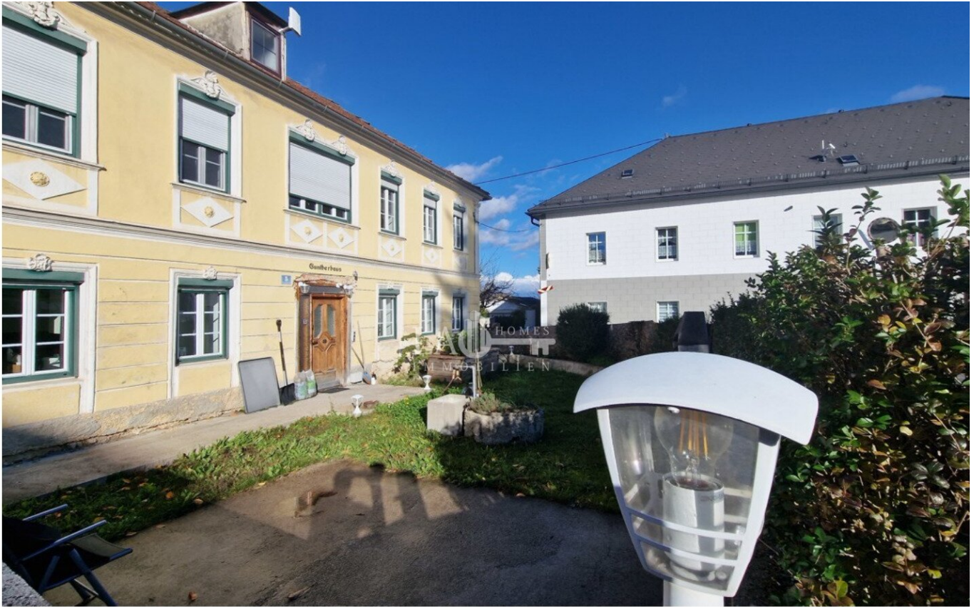
Blick von der Strasse