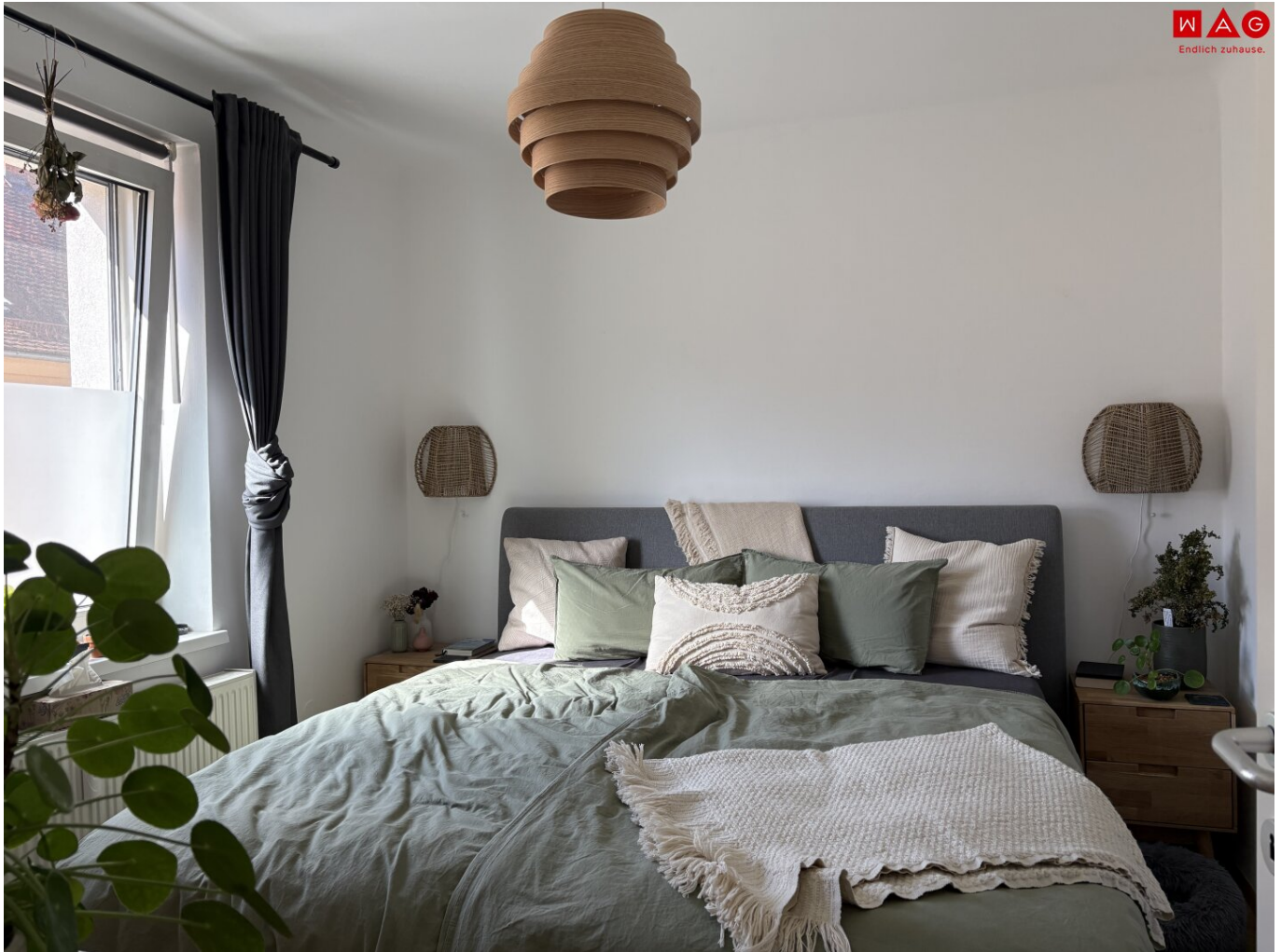
Kinderzimmer 2 (lt. Plan)