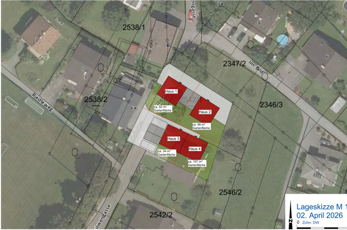
Lageskizze M 1: 500 02. April 2026 0 Zchn: DW 25m